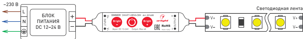
Рисунок 1. Схема подключения диммера SMART-MINI-DIM